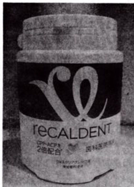
リカルデントガム 1080円

今回は「リカルデントガム」をご紹介します。私も好きでよくかんでいるのですが、味がおいしくて長続きするのでずっとかんでいられます。牛乳由来のカルシウムが入っていて、長くかんだ方が歯にもいいので一石二鳥です。ミント味とグレープ味があります。